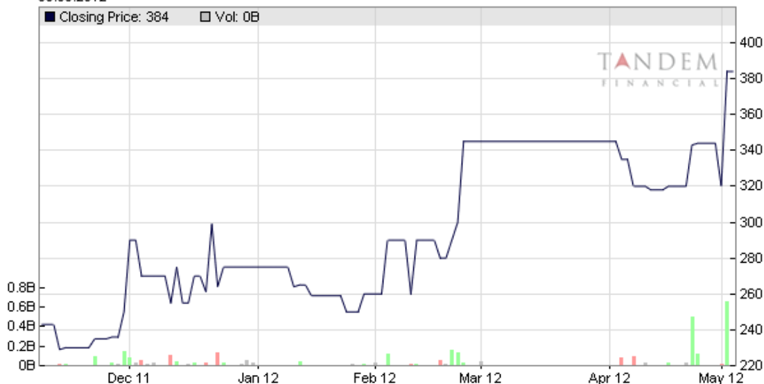
Slika 1. Kretanje cena akcije Neoplanta a.d.

Tokom proteklih 6 meseci je došlo do značajnog skoka cene akcija kompanije Neoplanta a.d. Cena je oscilirala na nivou od 240 do 300 dinara za jednu akciju početkom 2011 godine, da bi u martu mesecu skočila na 340 dinara, a u poslednjim danima ovog izveštajnog perioda na ovogodišnji maksimum od 384 dinara po akciji.